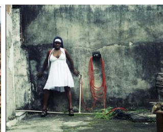
MODE © V. Achenbach I. Pacini