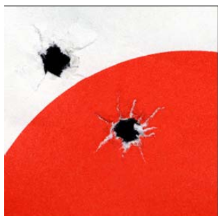
ABSTRAIT © Anita Cruz-Eberhard