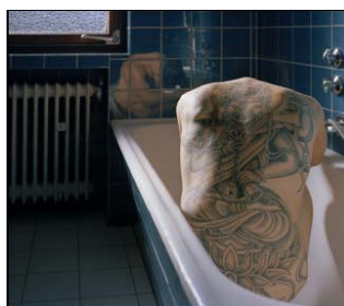
NU © Natalie Bothur