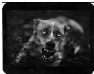
NATURE © Giacomo Brunelli