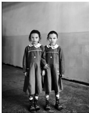
PORTRAIT © Vanessa Winship